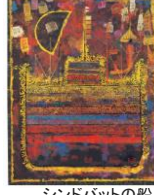
シンドバットの船

早川義孝展 色彩のシンフォニー 1/13(土)～3/10(日) ◆開館時間：10:00～18:00 (入館は17:30まで) ◆休館日：月曜日 ◆入館料：一般500円 団体450円(10名以上) 高校生以下無料