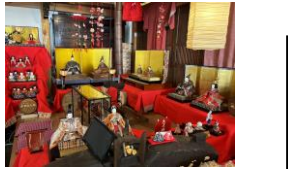
館最中本舗 湖月庵 休:火