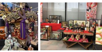
マスゼン 休:土日祝 日専連しもだて 休:土日祝