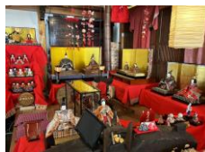
館最中本舗 湖月庵 休:火